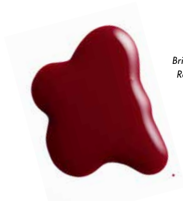
Brilliant Nail Red Allure

LIEBEVOLL GEPFLEGT UND SCHÖN BIS IN DIE FINGERSPITZEN.